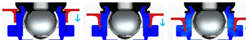
Шаровая опора блокируется при нажатии на рычаг подвески.

Шаровая опора имеет широкий воротник снаружи. Как только хомут окажется над краем рычага, шаровая опора замкнется сама. Вы можете сравнить это с тем, как функционирует зажим, который работает в одну сторону. Деталь легко вдавливается, но не может сдвинуться обратно. Шаровая опора полностью закреплена в рычаге подвески. Другими словами, Вы можете использовать решение Sidem для легкой и безопасной замены шаровой опоры в рычаге подвески.