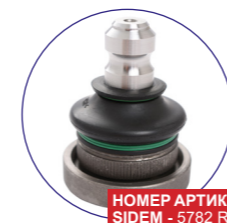
НОМЕР АРТИКУЛА SIDEM - 5782 R