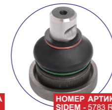
НОМЕР АРТИКУЛА SIDEM - 5783 R